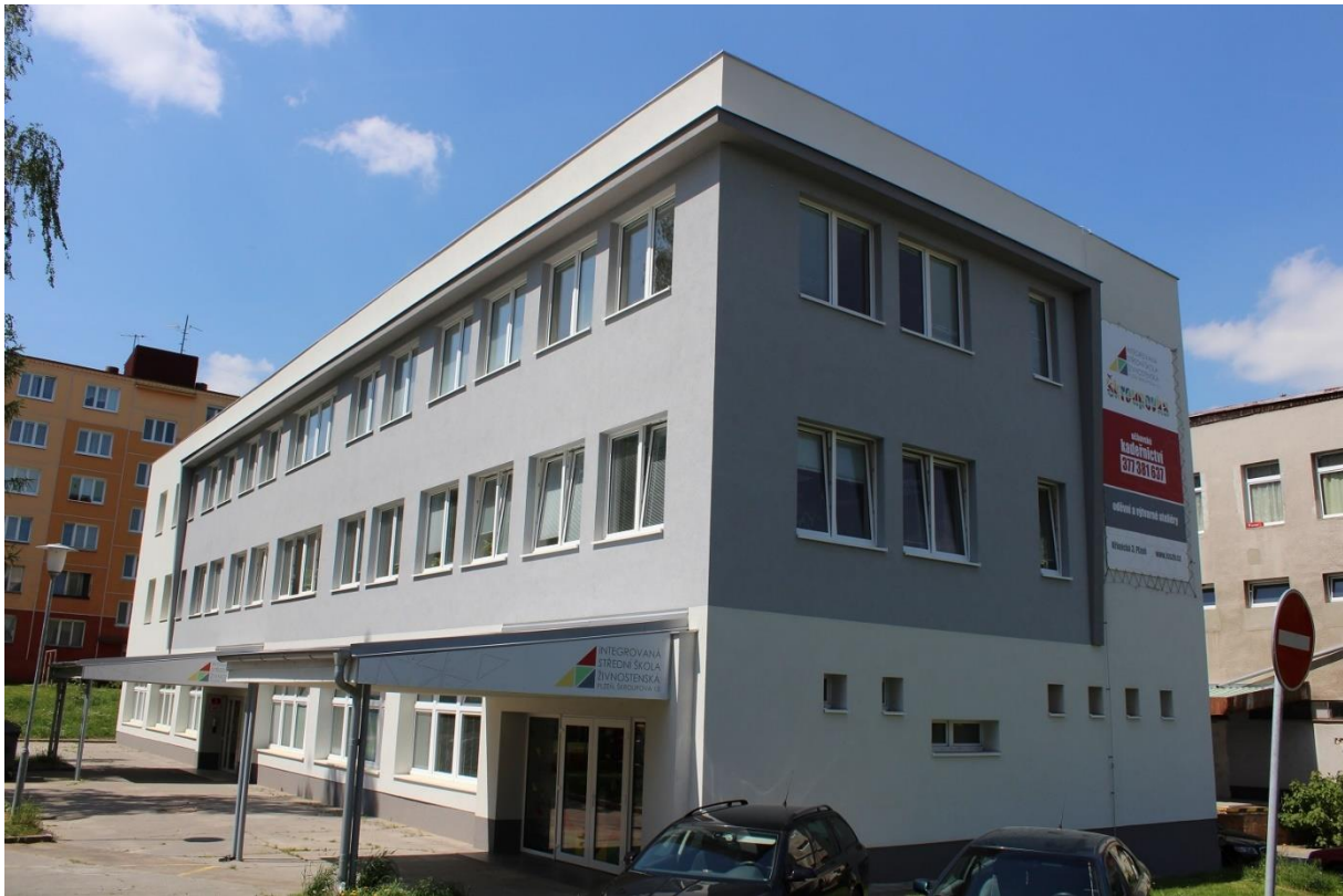
Budova školy Křimická ul. č. 3