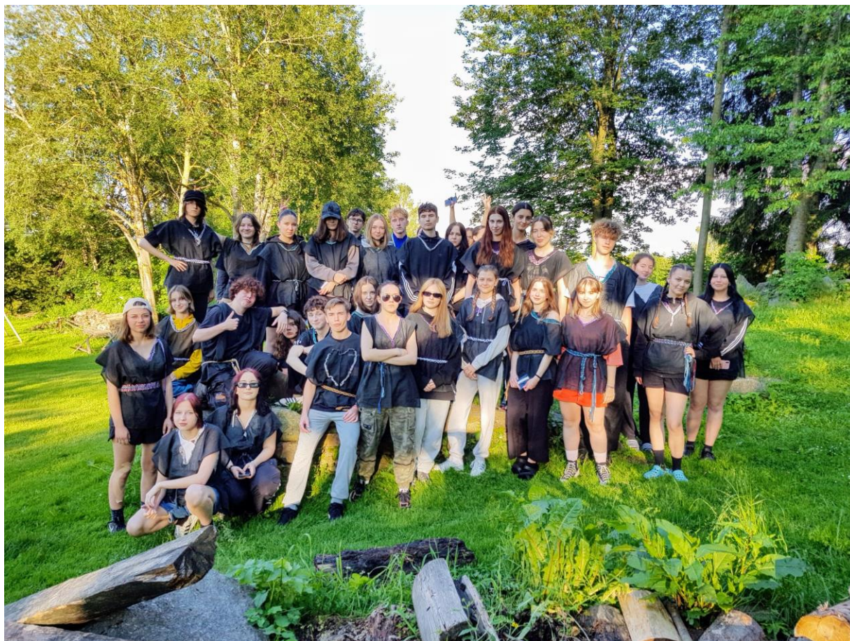
Turistický kurz – Po stopách Keltů