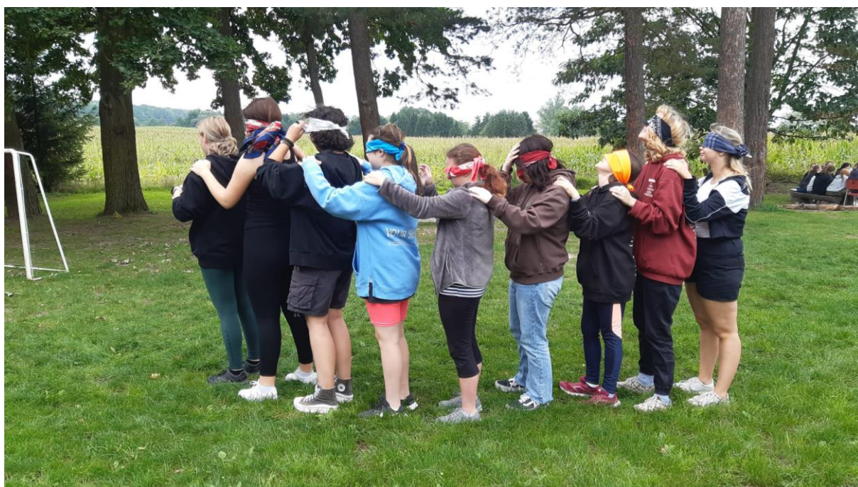
Seznamovací kurz – Svatý Štěpán u Chezovic

Žáci prvních ročníků (1EA, 1EB, 1KO, 1MO, 1KA, 1KB a 1KC) absolvovali třídní seznamovací kurz v Rekreačním středisku Svatý Štěpán u Chezovic. Cílem kurzu bylo, aby se žáci prvních ročníků vzájemně poznali a aby se sblížili se svými třídními učiteli. Připravený program byl zaměřen na aktivity, během nichž si žáci pomocí her zapamatovali jména svých spolužáků, zjistili o sobě základní informace a poznali charakteristiky druhých, naučili se vzájemně komunikovat a spolupracovat a zbavili se ostychu z neznámého prostředí. Tato akce se velmi osvědčila pro další fungování třídy jako kompaktní skupiny a vybudování zdravého klimatu třídy.