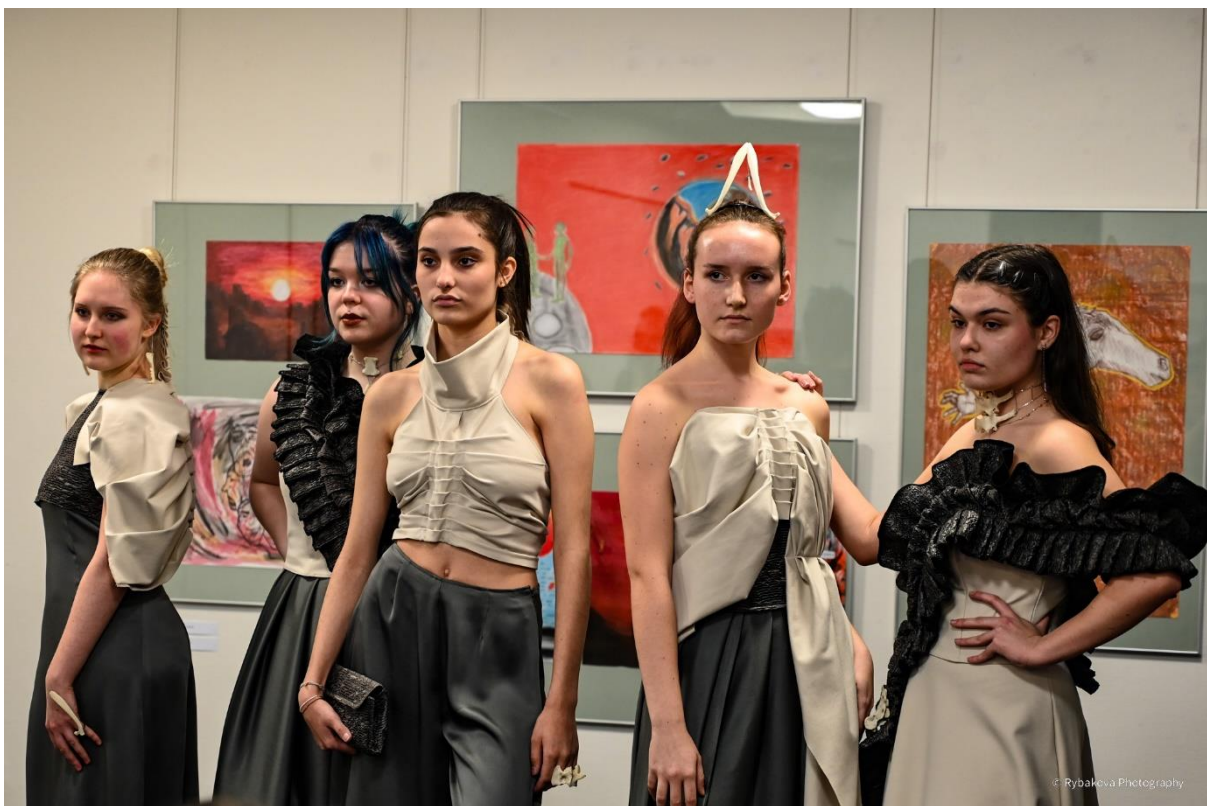
Chanovický plenér 2024